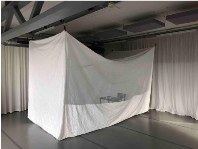
Proefopstelling Nieuwe Vorst ENCOUNTER#12

In mei en juni testten we het werk in Museum Arnhem als programmering binnen de Gratis Zaterdagen . Zo kreeg het werk langzaam maar zeker gestalte. Tegelijkertijd schreven we verschillende subsidieaanvragen om het project te realiseren in het eerste en tweede kwartaal van 2025. In het derde en vierde kwartaal ontvingen we subsidies van Fonds voor Cultuurparticipatie, gemeente 's-Hertogenbosch en Stichting de Zaaier waarmee we ENCOUNTER#12 zijn gaan realiseren.