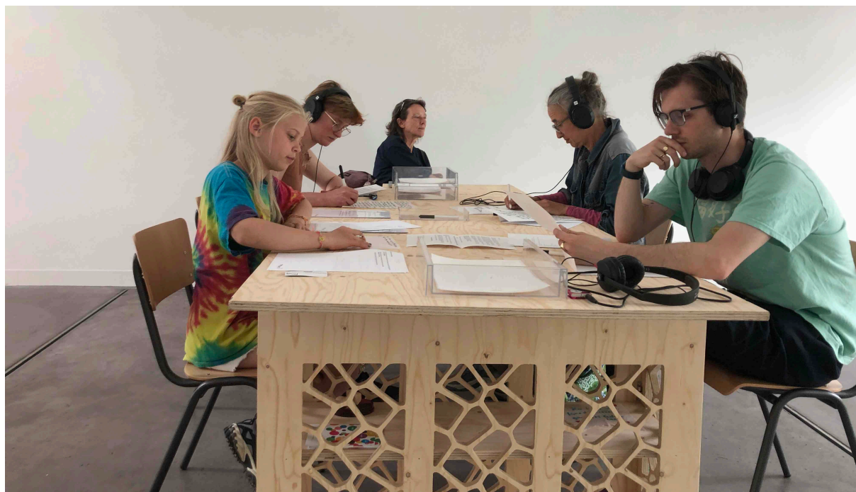
ENCOUNTER#12, deelnemers aan het Gratis Zaterdagen-programma in Museum Arnhem, mei 2025.