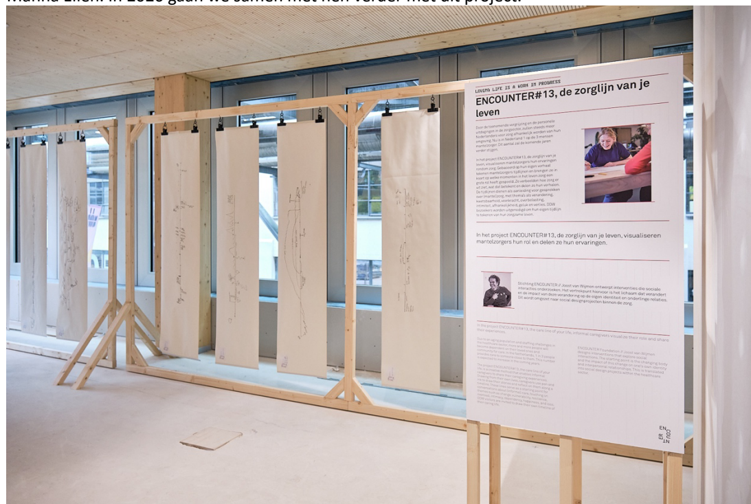
Expo ENCOUNTER#13 tijdens DDW25