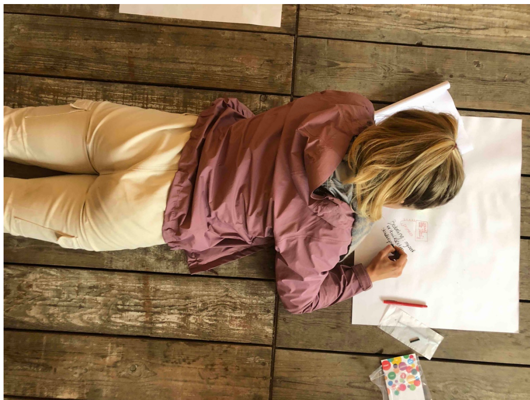
ENCOUNTER#11, deelnemer aan de eerste Zorgzaam Improviseren sessie.