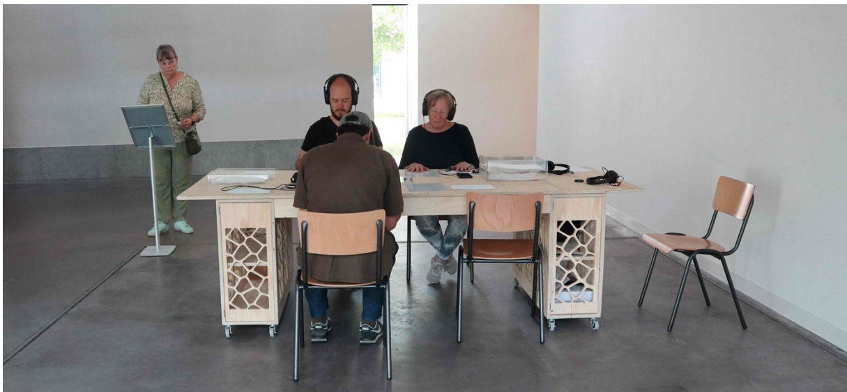
ENCOUNTER#12, deelnemers tijdens de Gratis Zaterdagen

In Lief lichaam worden museumbezoekers gevraagd om een brief aan hun lichaam te schrijven. Vervolgens eten ze deze brief op. Hiermee worden deelnemers uitgenodigd de eigen relatie met hun lichaam te onderzoeken. Naast deze ontworpen publiekservaring vragen we ook verschillende mensen en groeperingen uit Arnhem en omgeving om aan het project deel te nemen. Vervolgens hebben we 15 van hen gevraagd of ze onderdeel wilden worden van het kunstwerk, door het moment waarop de brief wordt opgegeten vast te leggen. Deze gefilmde 'portretten' van de briefeters worden getoond in het museum.